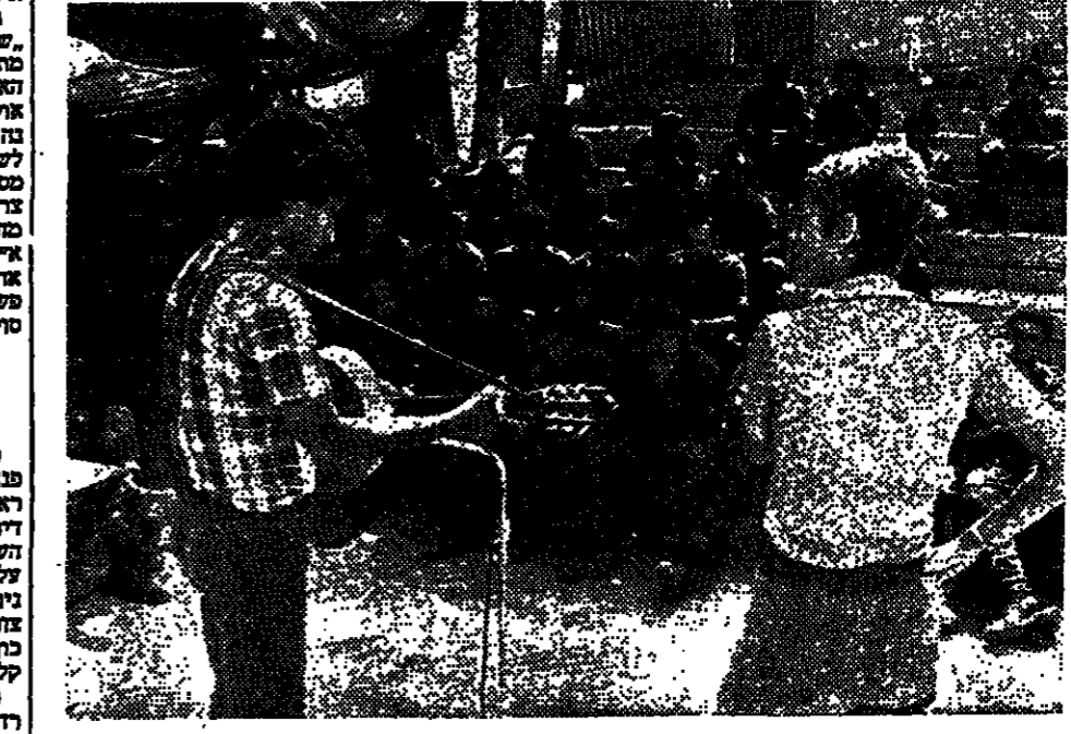
התפרוץ המוסיקלי במסגרת טקס הקבורה של מרדכי פיטילון, בהשתתפות אלפי אנשים.

משה גרדון (9) - משה גרדון, ראש ממשלת ישראל לשעבר, נערכה טקס קבורה.